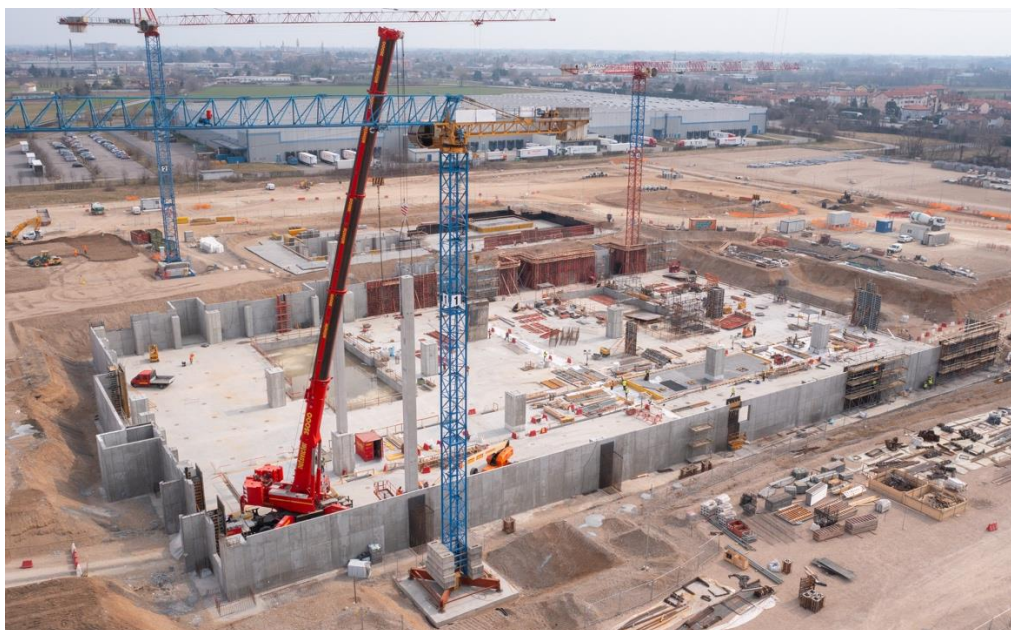
Boffalora Sopra Ticino (MI) - Progetto in corso per Vetropack

Tra i progetti in corso, proseguono i lavori per la realizzazione di un moderno stabilimento industriale di 120.000 mq a Boffalora Sopra Ticino (MI): un grande progetto di rigenerazione urbana che, grazie a importanti interventi di bonifica ambientale, ha permesso di recuperare un'area post-industriale dismessa di oltre 330.000 mq lungo il Naviglio Grande. Il nuovo impianto sarà integrato da uffici e magazzini automatizzati multilivello, in linea con le più severe norme di sostenibilità ambientale applicate all'industria e riconversione urbana e nel pieno rispetto del contesto e memoria sociale.