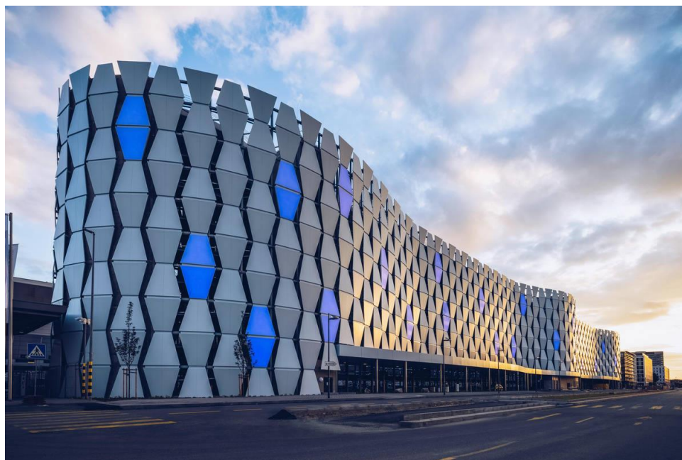
Francoforte - Parcheggio Goldbeck realizzato per Fraport Group