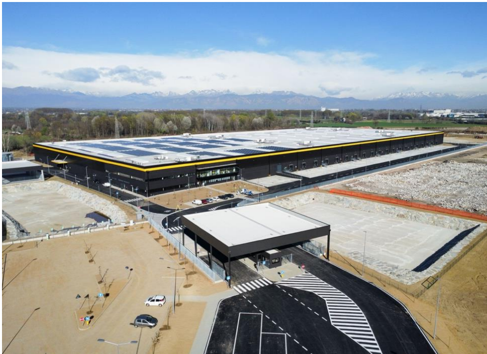
Settimo Torinese (TO) - Progetto realizzato per Kervis SGR, in qualità di gestore del Fondo BGO Logistics Fund 1, interamente investito da BentallGreenOak

La promozione del benessere aziendale è un tema a cui GSE ha riservato la massima attenzione durante quest'ultimo esercizio, attraverso il rinnovo dei propri uffici dotandoli di spazi multifunzionali per favorire l'interazione e il lavoro in team e una serie di programmi di formazione destinati all'insieme delle proprie risorse per un totale di 322 ore.